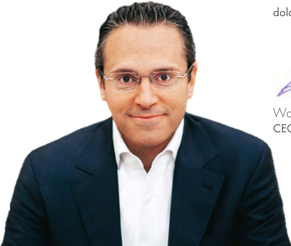
Wael Sawan CEO

Etik ve uyumluluk konusundaki kararlılığınızdan dolayı teşekkür ederiz.